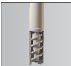
Girante a vite